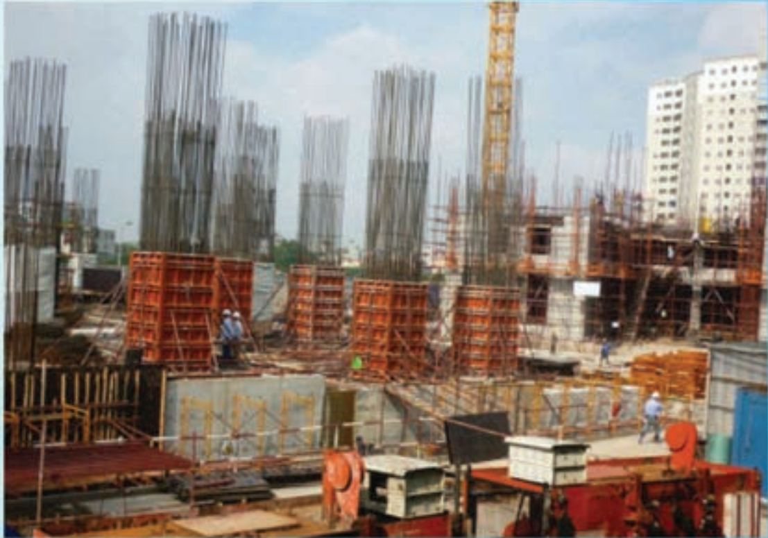
Thi công cột vách tầng 1 1 st floor wall column construction