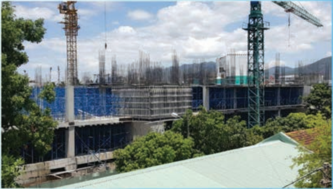
Công trình đang thi công phần kết cấu In progress of structure construction