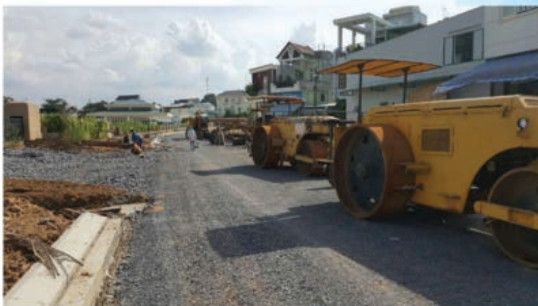
Thi công kết cấu đá lớp 2 Aggregate - Layer 2