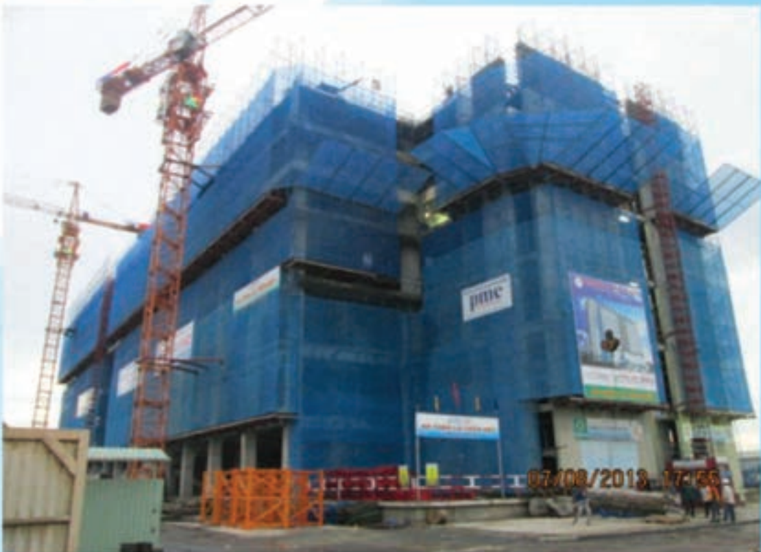
Mặt đứng trục A - C Elevation A-C