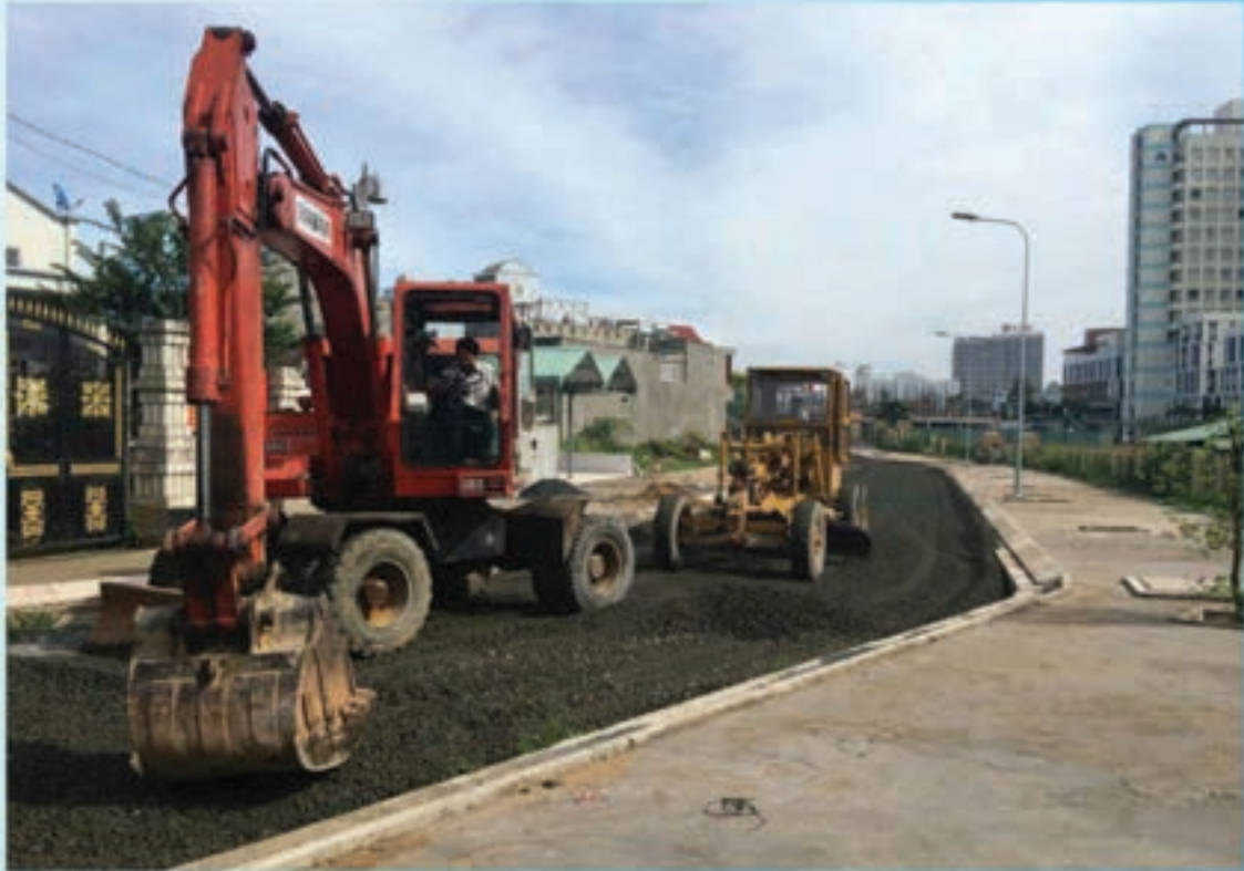
Thi công kết cấu đá lớp 3 Aggregate - Layer 3