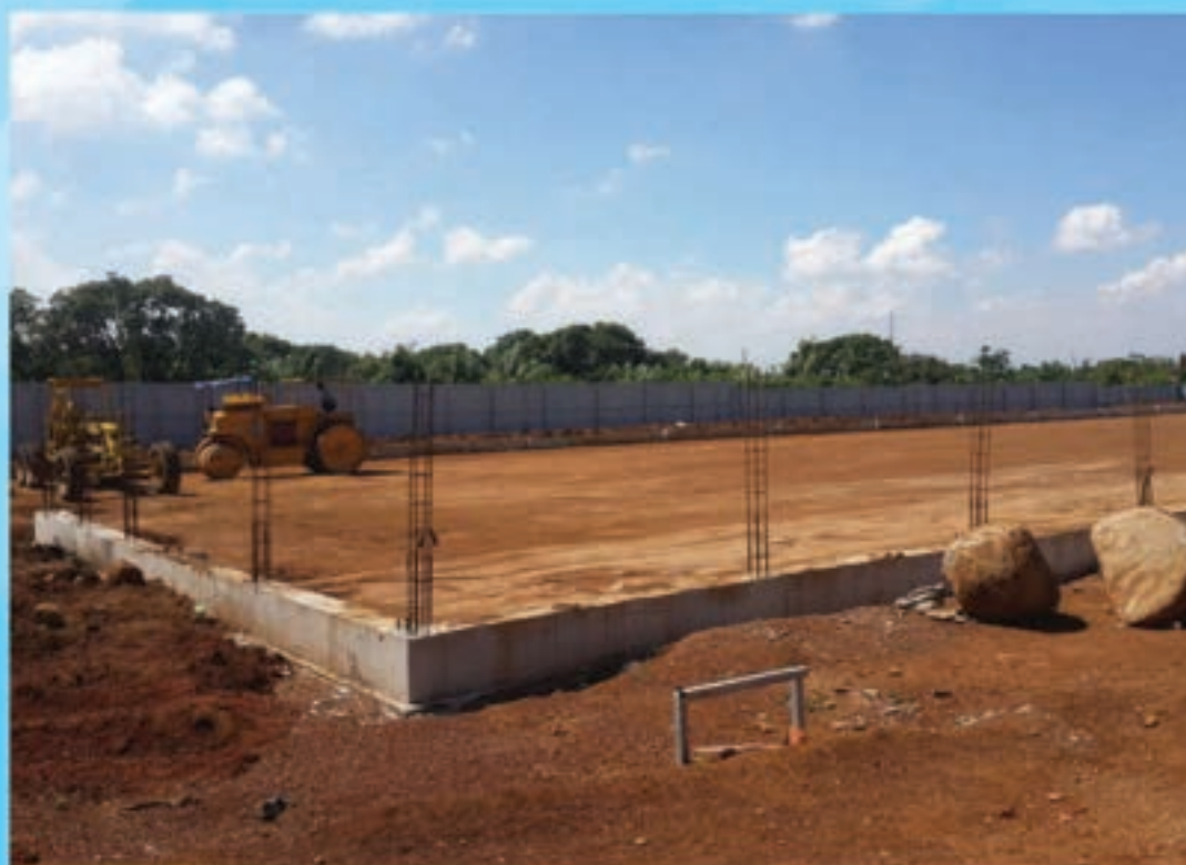
Thi công phần đất nền xưởng Foundation earthwork