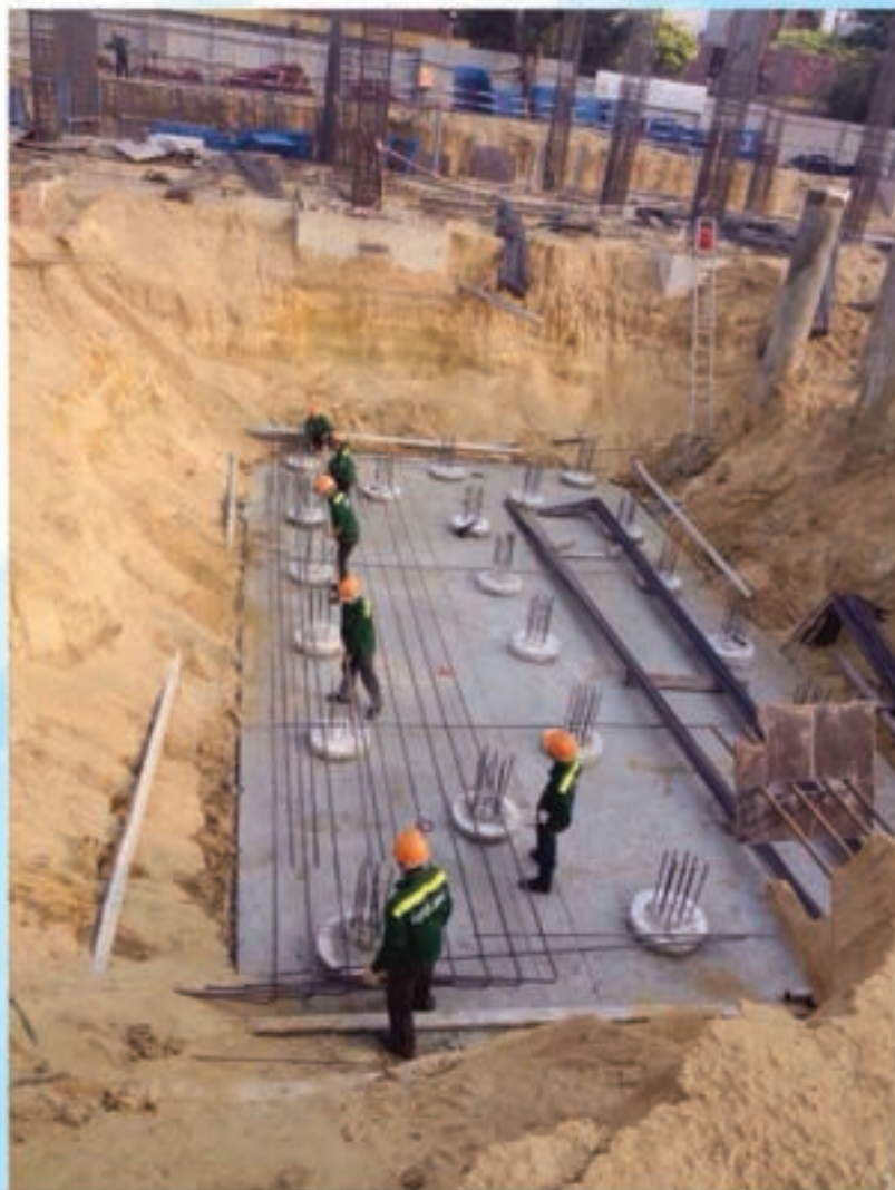
M6 Foundation construction