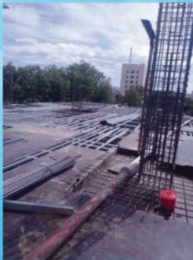
Thi công thép sàn trệt cốt +0.000 Reinforcement of ground floor +0,000