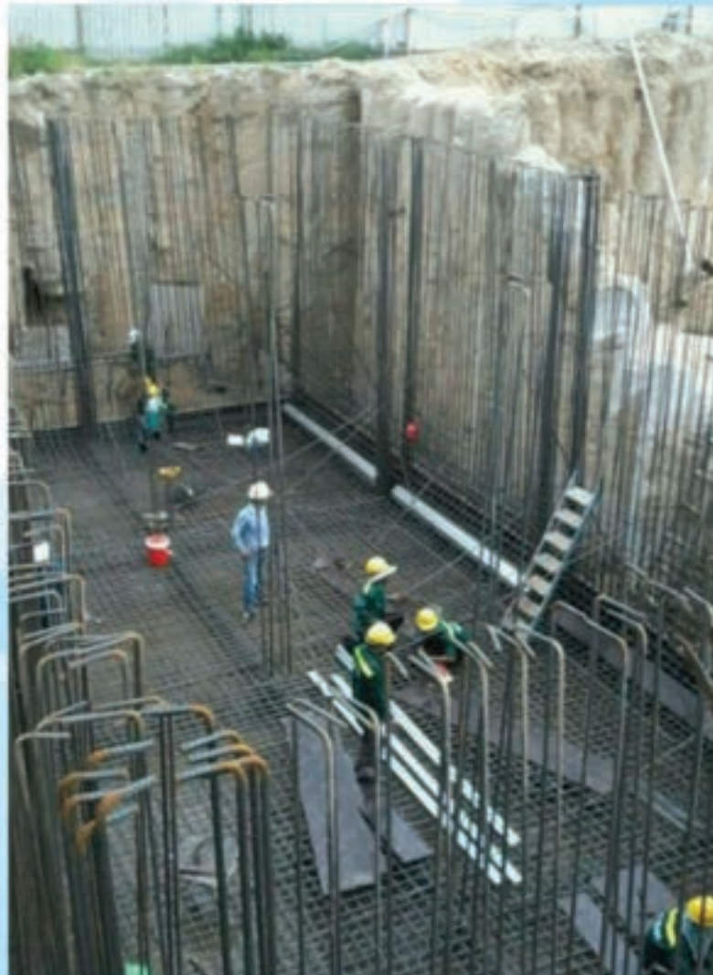
Basement foundation construction

Block B: High-quality villas and apartments: VND 22.941.036.000