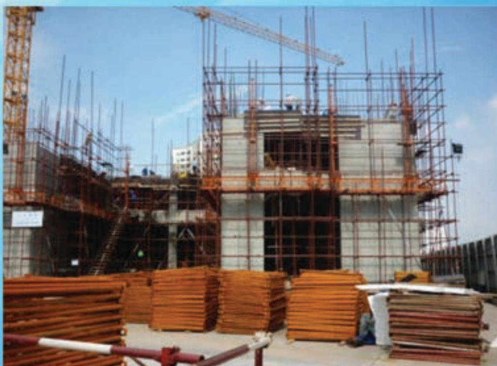
Khu vực tập kết vật tư, thiết bị Material and equipment yard