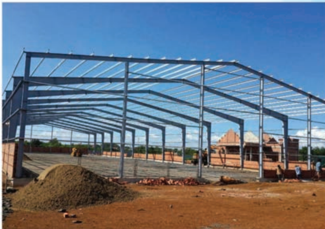
Thi công phần đá nền xưởng Foundation aggregate