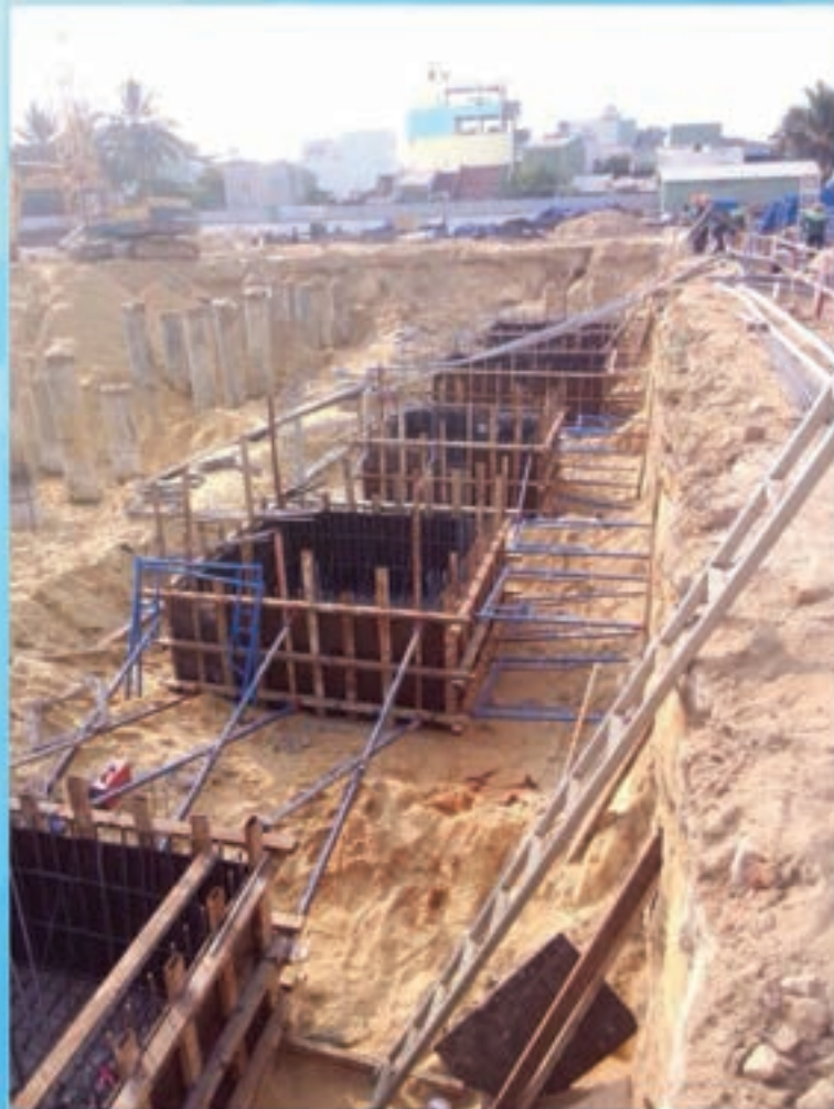
M2 Foundation construction