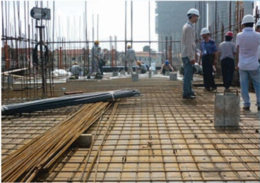
Thi công sàn tầng hầm Basement foundation construction